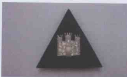
PARCHE INSTITUCIONAL TENIDA N°1 OFICIALES, SUBOFICIALES MAYORES Y SUBOFICIALES.