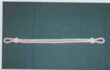
BARBOQUEJO OFICIALES, SUBOFICIALES MAYORES Y SUBOFICIALES

VI. Barboquejo de la Gorra Institucional: El Barboquejo plateado utilizado por los Oficiales Penitenciarios, Suboficiales Mayores y Suboficiales es reemplazado por un cordón plateado. Los Sargentos, Cabos y Gendarmes mantendrán el barboquejo negro actualmente en uso.