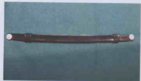
BARBOQUEJO SARGENTOS, CABOS Y GENDARMES

2. Se dispone el control por parte de las Jefaturas correspondientes, respecto del uso de los distintivos de grado en cada uno de Establecimientos Penitenciarios, Unidades Especiales y Dependencias Institucionales, quedando porhibido el uso de los antiguos distintivos de grados, a partir del día 02 de noviembre del año en curso. Además, se prohíbe el uso indebido de los nuevos distintivos. El incumplimiento de las instrucciones relativas a esta materia será causal suficiente para que dichas Jefaturas adopten las medidas administrativas pertinentes.