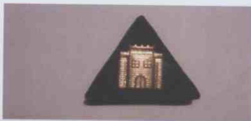
PARCHE INSTITUCIONAL TENIDA N°1 SARGENTOS, CABOS Y GENDARMES