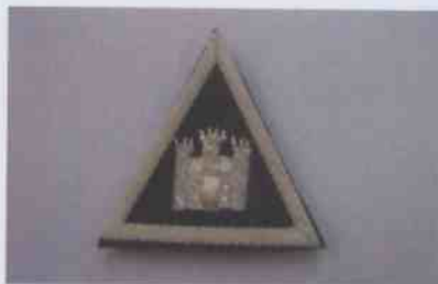
PARCHE INSTITUCIONAL TENIDA N°1 OFICIALES SUPERIORES