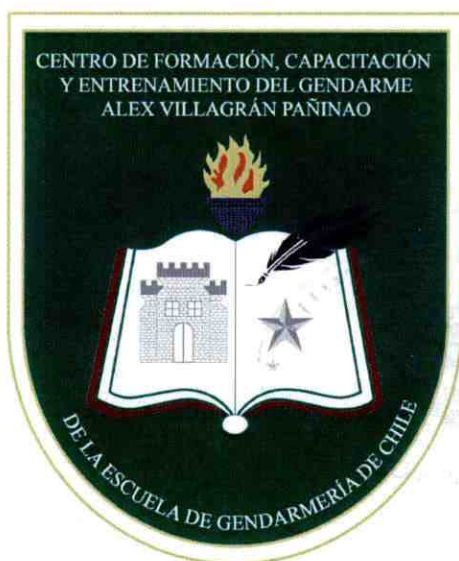
Escudo del Centro de Formación, Capacitación y Entrenamiento "Del Gendarme Alex Villagrán Pañinao"

Artículo 39°C.- La Bandera del Centro de Formación, Capacitación y Entrenamiento "Del Gendarme Alex Villagrán Pañinao", será de color verde alemán y en su centro irá inserto el Escudo del Centro, el cual será de un \frac{2}{5} del ancho x un \frac{2}{3} del alto de la bandera. Serán de tres tamaños, conforme al asta que se utilice para izarla y del Pabellón Nacional o Institucional que la acompañe, sus dimensiones serán las siguientes: