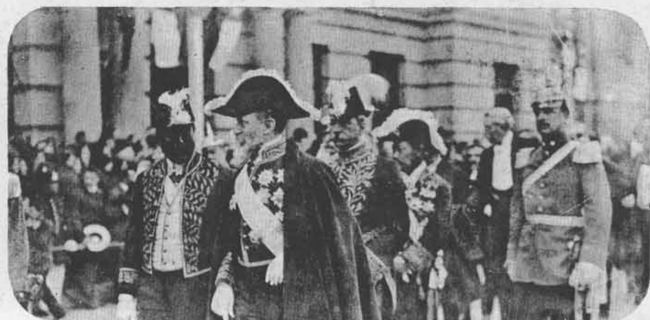
I. Los Ministros de Bolivia, Uruguay, España, Japón y Brasil.—II. El general Yáñez acompañado de marinos argentinos.—III. Diplomáticos sud-americanos.