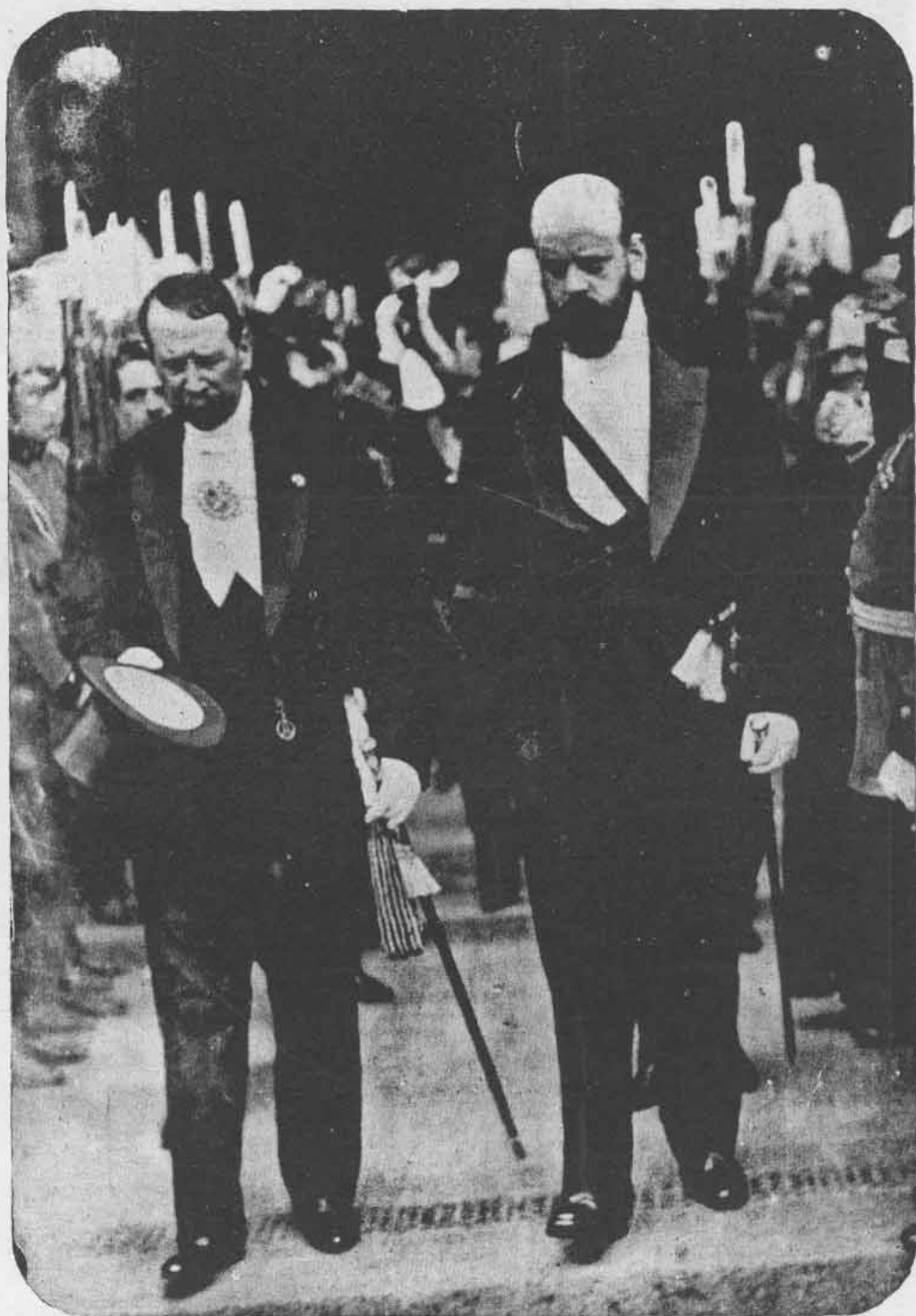
El Excmo. señor Presidente de la República Argentina y S. E. el Vice-Presidente de Chile saliendo de la Catedral después del Te-Deum solemne del día 18.