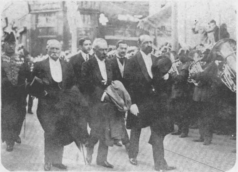
Don Ramón Barros Luco en dirección á la Moneda después de haber asistido al Te-Deum